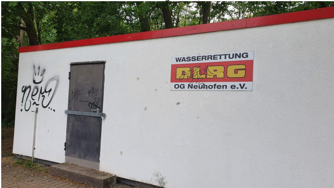
Leider immer wieder - Sachbeschädigungen an unseren Wachstationen

Leider gab es auch mal wieder eine Überraschung an unserer Wachstation an der Schlicht. Dort versuchten unbekannte Täter unseren Materialcontainer erfolglos aufzubrechen. Aber der Schaden am Türblatt ist vorhanden. Daneben müssen wir leider auch immer wieder Sachbeschädigungen durch Farbschmierereien feststellen. Daher eine dringende Bitte: Wenn Sie entsprechendes Verhalten oder unberechtigte Personen an den Stationen außerhalb der Besetzung unserer Stationen feststellen, informieren Sie bitte die Polizei oder einen der Vorstandsmitglieder (siehe Adressübersicht).